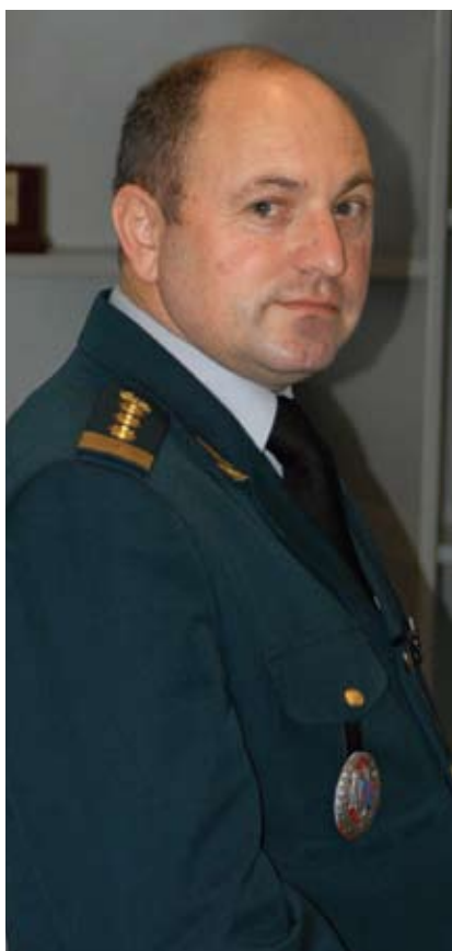
– Domnule colonel, cum este organizat procesul didactic în Academia Militară?

– Începând cu anul 2009, am restructurat planurile de învățământ la ciclul I – studiile de licență și ciclul II – studiile de masterat în așa fel, încât să le aducem la standarde internaționale. La ciclul I am introdus discipline noi, care se studiază în academiile moderne: securitatea națională și apărarea, relațiile civil-militare, relațiile cu mass-media, operațiuni