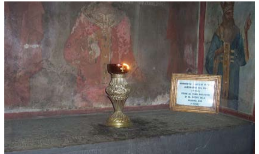
Mormîntul lui Alexandru cel Bun și al soției Ana în cadrul mănăstirii Bistrița