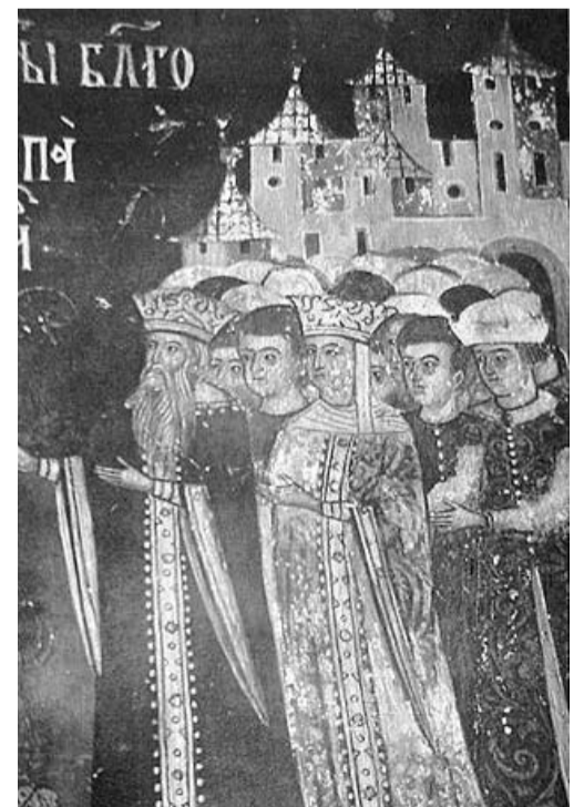
Alexandru cel Bun și soția sa, doamna Ana, frescă la Mănăstirea Sucevița