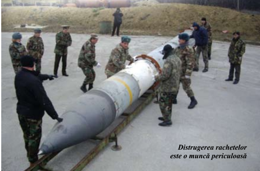
Distrugerea rachetelor este o muncă periculoasă

tat Convenția cu privire la munițiile cu fragmentare, semnată în 2008 la Oslo, nimicind toate munițiile de acest tip, aflate pe teritoriul controlat de organele constituționale. Mai întii au fost dezamblate și neutralizate 78 de bombe cu fragmentare, iar mai apoi nimicite prin