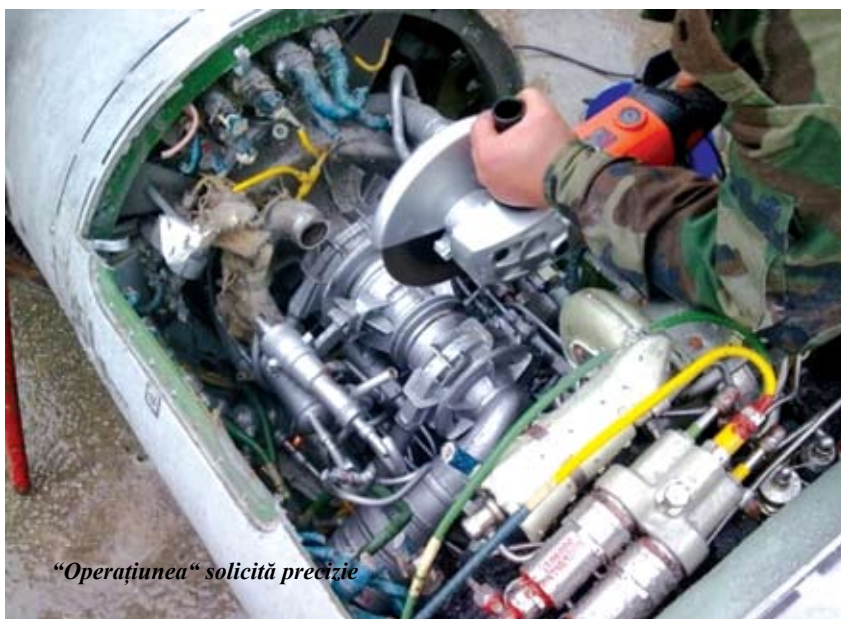
„Operațiunea” solicită precizie

Căpătînd experiență în domeniu, militarii Armatei Naționale au început să folosească noi metode de nimicire a munițiilor expirate, nu atît de periculoase precum exploziile. Astfel, prin metoda deflagrației, produsă de șocul termic, au fost distruse 106 bombe de aviație de tip OFAB 250-270. Această procedură a fost aplicată pentru reducerea undei de șoc și a schijelor, ce rezultă în urma detonației și care puteau afecta populația din zona adiacentă și personalul implicat în procesul de nimicire.