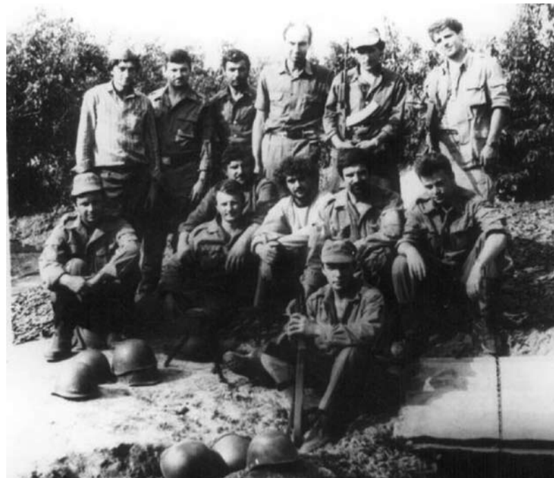
„Cu multă bucurie, așa a fost reînțînirea!”

Cu licăriri de apă cristalină în ochi vorbește și despre părinți, care din iunie și pînă în august au trăit prin intermediul „comunicatelor de război” ale presei, viața scumpului fecior.