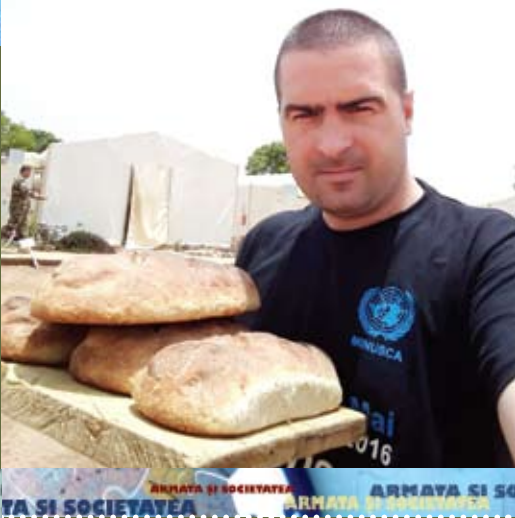
ARMATA SI SOCIETATEA ARMATA SI SOCIETATEA

Atac anual la bugetul statului de 1 miliard de lei sau cum suntem deposedați de acești bani fără a ne da seama