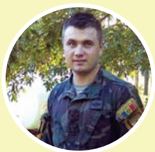
Locotenent major Radu ȚURCANU

Peste 150 obiecte explosive au fost dezamorsate de geniștii noștri aflați în misiunea de pace din Kosovo. Printre acestea se numără 70 de proiectile de diferite calibre, 10 submuniții, 10 grenade de mână și 3 grenade antitanc. Depistarea, transportarea și nimicirea obiectelor explosive a contribuit la salvarea a mii de vieți omenești.