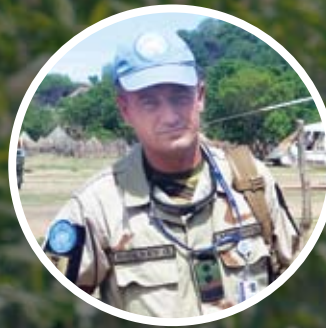
Locotenent-colonel Grigore BODAREV, UNMISS, Misiunea ONU, Sudanul de Sud

” Suntem o armată mică, dar cu o dorință puternică de a face progrese.