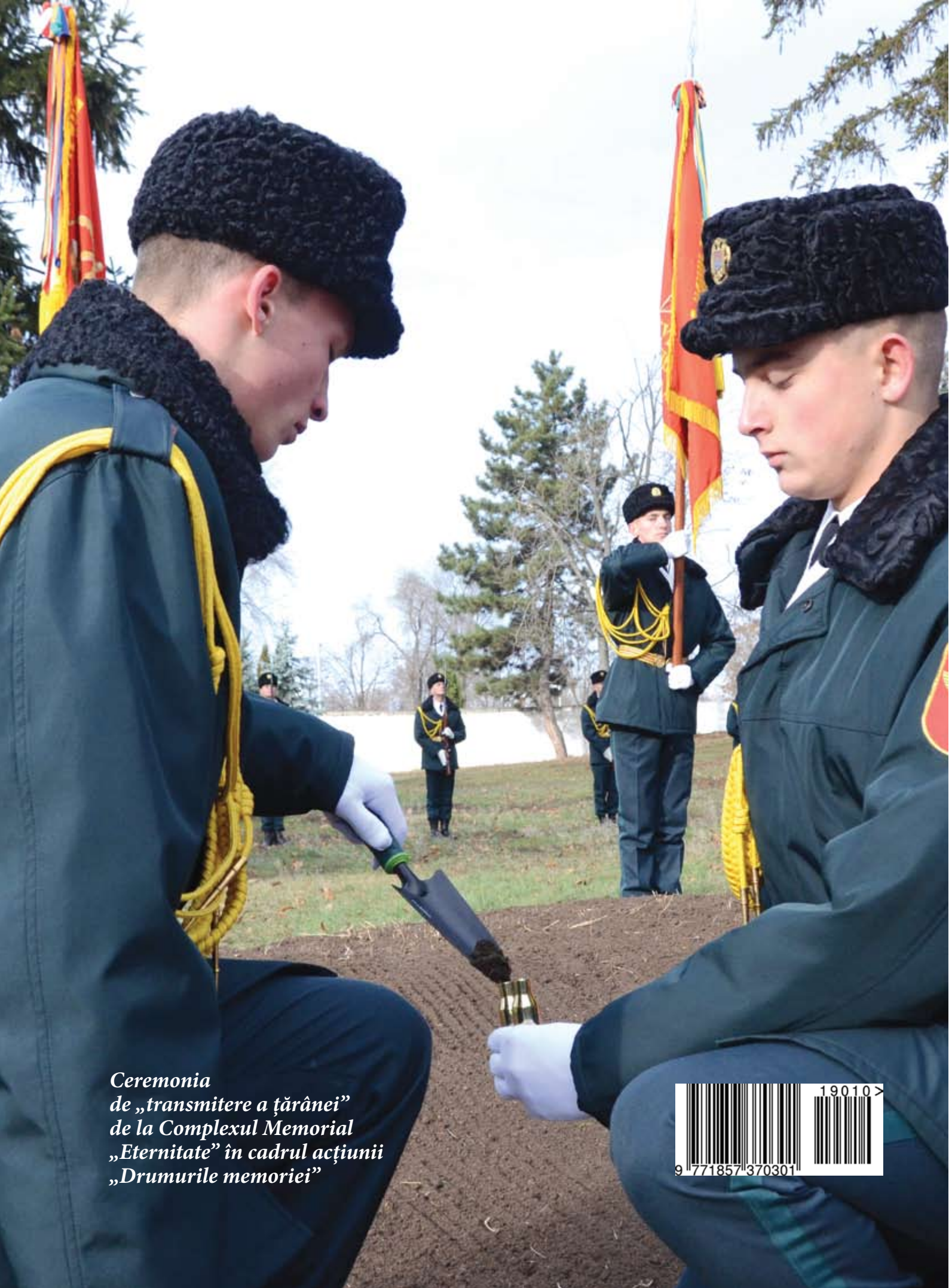
Ceremonia de „transmitere a țărânei” de la Complexul Memorial „Eternitate” în cadrul acțiunii „Drumurile memoriei”