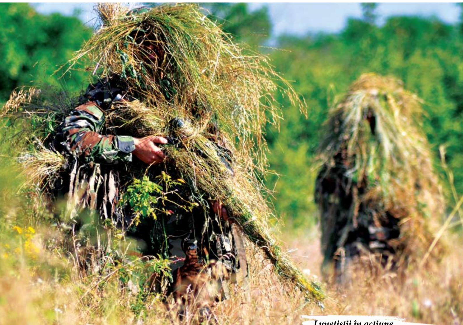
Lunetiștii în acțiune