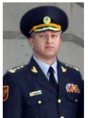
Colonel Oleg CEBOTARI, șef Direcție protocol și ceremonial:

„Atunci cînd stai lîngă drapel ești cuprins de mîndrie, dar și de griji, pentru că ești prima persoană pe care o vede un oficial străin și trebuie să fii impecabil atît prin ținută fizică, cît și morală. Noi sîntem cei care reprezentăm țara, armata și doar prin muncă asiduă și mult devotament reușim să ne îndeplinim această nobilă obligație. Mulțumesc tuturor celor care au depus efort și răbdare în pregătirea noastră, astfel încît azi de la soldat și pînă la ofițer, fiind aliniați la diferite ceremonii, să fim demni că facem parte din Garda de Onoare a Armatei Naționale.”