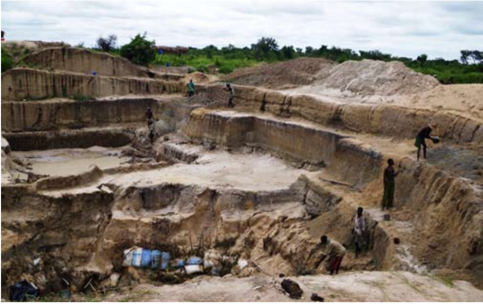
Lucrări de extragere a aurului