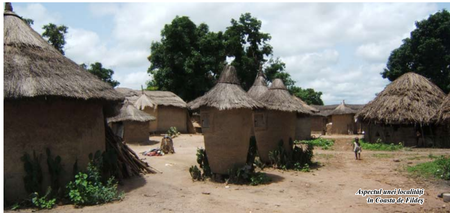
Aspectul unei localități în Coasta de Fildeș