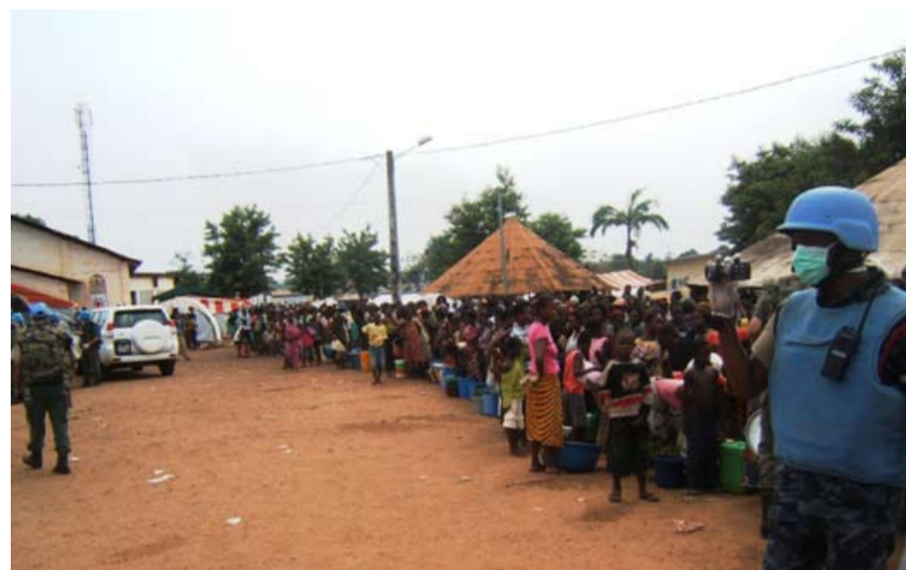
Rînd la distribuția apei

ție radical diferită în localitatea Bouake. „În Bouake, nu doar că „puteai să respiri aer curat”, dar și localnicii aveau o atitudine foarte bună față de forțele ONU. Aceeași situație era în Korhogo, unde este dislocat la acel moment și team-ul din