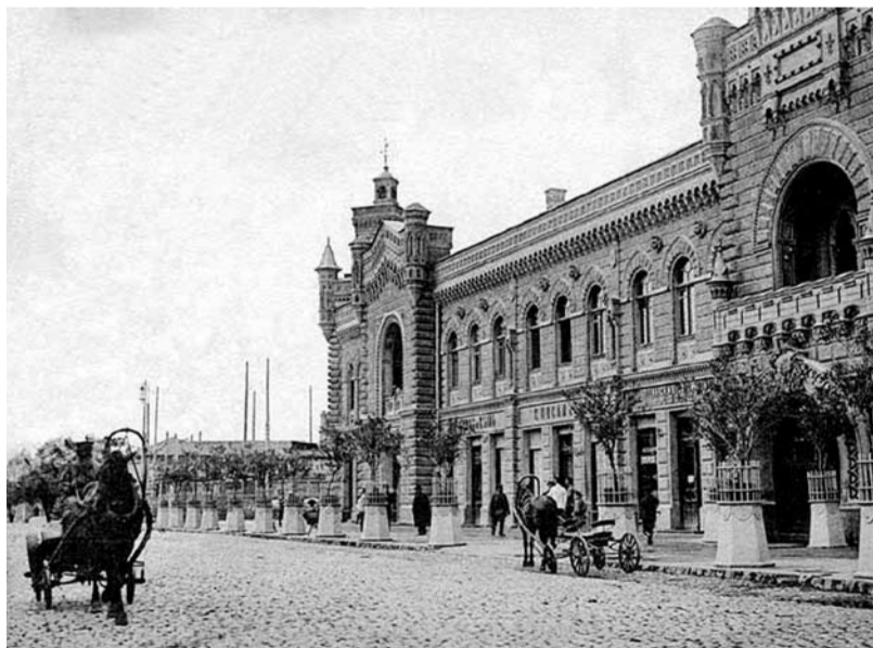
Orașul Chișinău, sf. sec. al XIX-lea

lui D. Cantemir, constituiau 8 steaguri (800 ostași), la 1772-1773 numărul doar 59 de persoane.