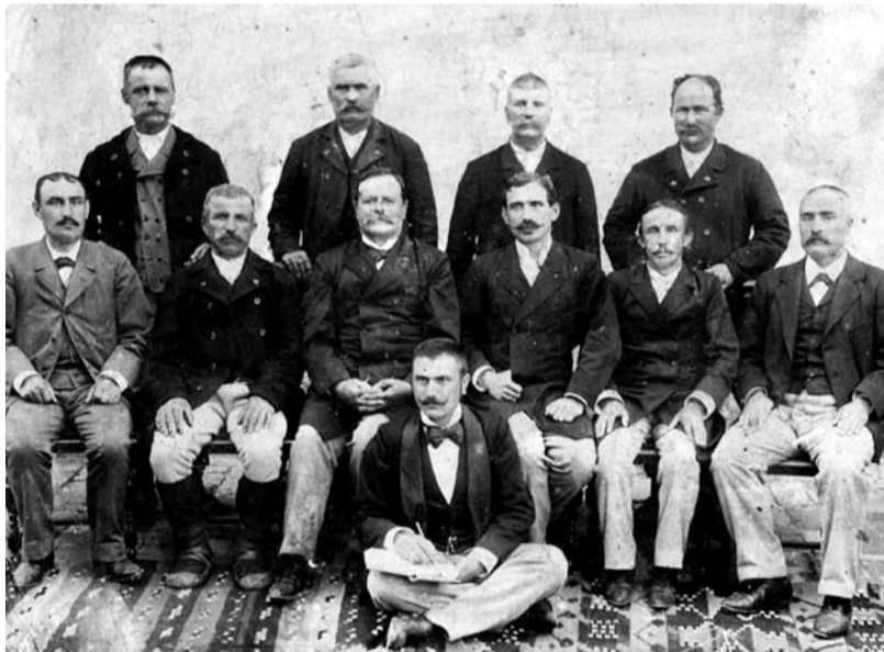
Funcționari comunali, ultimii ani ai sec. al XIX-lea

În 1772-1773, conform recensămintului, din categoriile de slujitori cu funcții militare făceau parte seimenii – ostași lefegii, de regulă, originari din alte țări, plăieșii, cazacii, călărașii, dărăbanii, roșii care se aflau în supunerea marelui hatman. Slujitorii hătmaniei erau concentrați în ținuturile de margine: Soroca, Orhei-Lăpușna, apoi la Neamț, Bacău, Putna și Covur-lui. O parte dintre slujitorii hătmaniei fuseseră dislocați în capitală (seimenii călărași). Plăieșii fuseseră dislocați în pichetele de la hotarul cu Transilvania, iar trecătorii și punctele vamale de la Nistru erau păzite de cazaci și călărași. Marele agă avea în ascultare seimenii, dărăbanii și roșii, de obicei, dislocați în capitală. Conform recensămintului din 1772-1773, în capitală fuseseră concentrați majoritatea seimenilor agiești (133 din 139), beșliii (25 din 31) și dă-