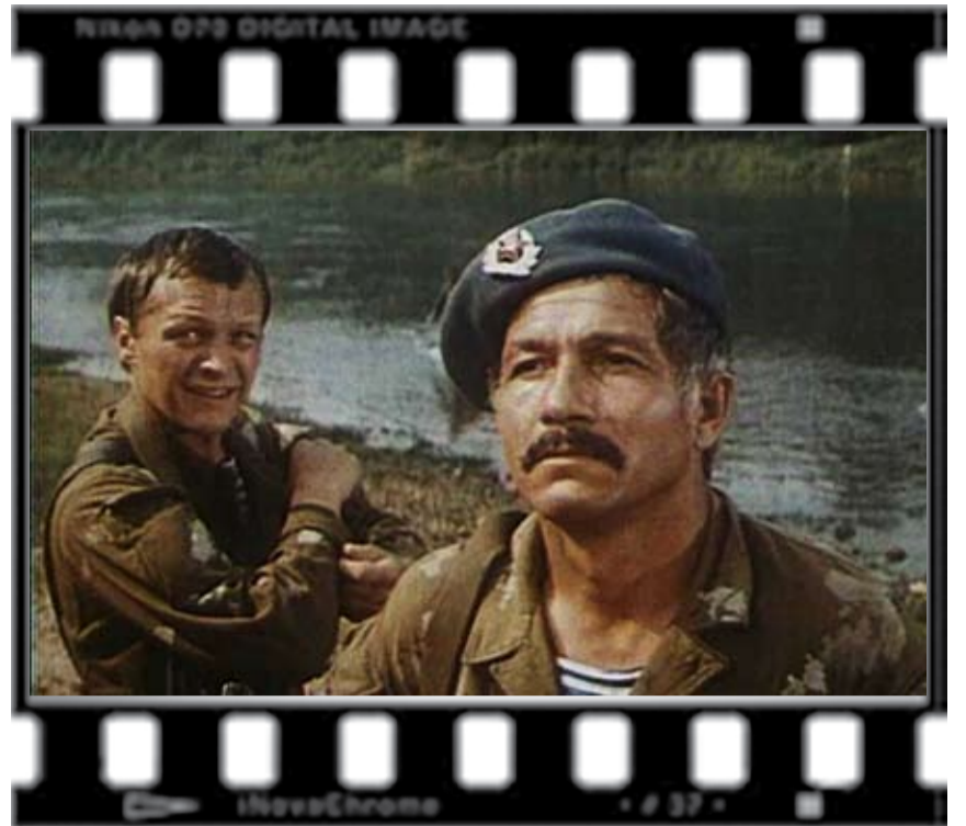
„В зоне особого внимания”