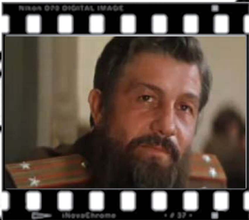
„De la Bug pînă la Visla”

– Deschideți-ne secretul, cum ați reușit să faceți o carieră perfectă atît în cinematografie, cît și la teatru?