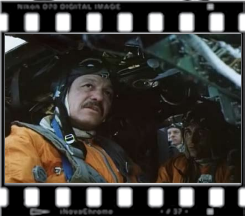
„Случай в квадрате 36-80”

– Desigur! O școală bună a vieții! Unde eu puteam să aflu, să văd și să fac toate aceste lucruri noi, decît pe platoul de filmare? Școala vieții, da... Cred că anume această școală m-a făcut așa cum sînt. Acum de vreo cîțiva